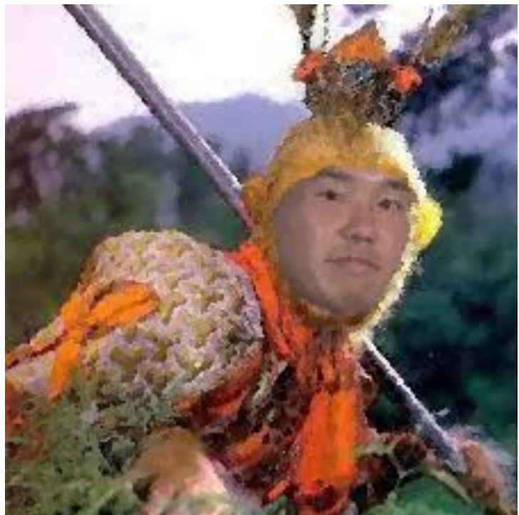
提安索豪尔《有东亚男子脸部的文学形象》，2019 年

拉脱维亚艺术家提安索豪尔读毕本文后作大感叹，将帆布上已绘制完毕的孙悟空画作脸部涂抹并重新构思，画上文中“野兽先辈”的形象。